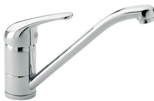
龙头 S1000 - RO 8443 002