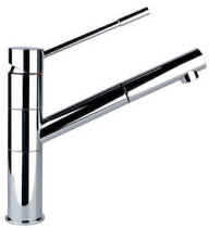
龙头 Lorenzo 8466 000